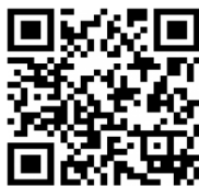
QR Code เว็บไซต์ฯ

ทั้งนี้ การเลือกกลุ่มคนเป้าหมายวิกฤต/คนจนเป้าหมายที่ต้องเร่งให้ความช่วยเหลือจะต้องเป็นกลุ่มที่ตกเกณฑ์มิติ MPI อย่างน้อย ๓ มิติ